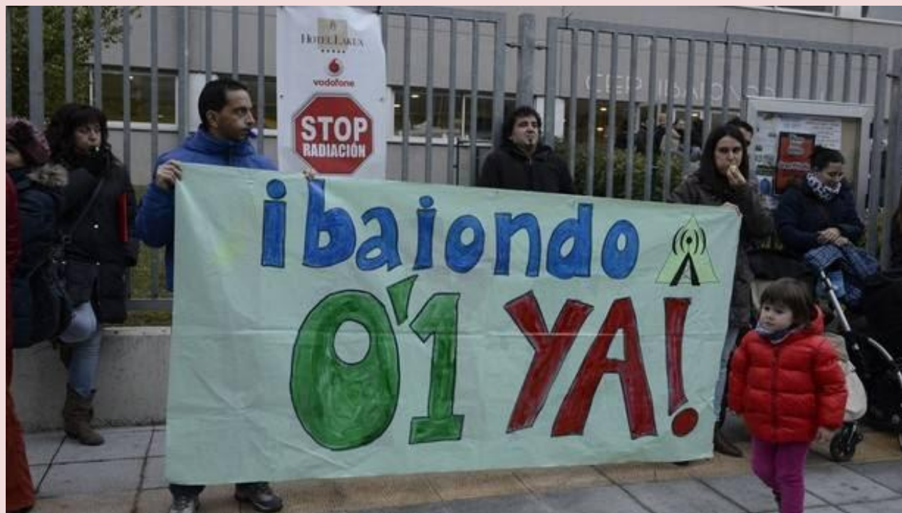
Familias de la ikastola Ibaiondo en Gasteiz.